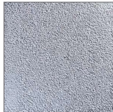
PR-23 3/6 40x40 fons GRIS-PERLA