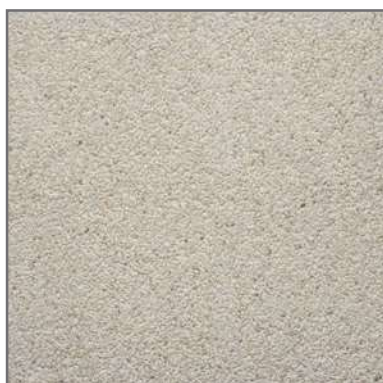
PR-40 3/6 40x40 fons MARFIL Marfil platja piscines