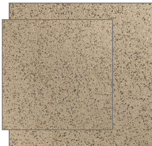
PR-690 2/4 ▲ fons MARRÓ 40x40 - 50x50