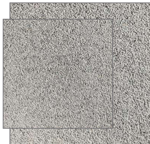
PR-680 5/7 ▲ 40x40 - 50x50 fons GRIS