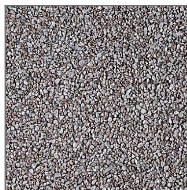
PR-28 3/6 fons NEGRE 40x40

La cara vista de la peça raspallada permet composicions amb un ampli ventall de mides d'àrids que estan distribuïts de manera uniforme a la peça. Abans que endureixi l'aglomerat superficial, es raspallen i renten, i queda a la vista l'aglomerat petri resultant una superfície d'excel·lent resposta als requeriments antilliscants.