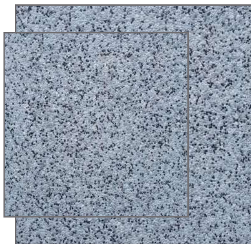
PR-694 2/5 ▲ fons GRIS 40x40 - 50x50