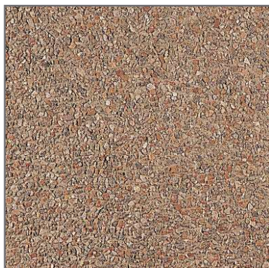
PR-29 3/6 fons MARRÓ 40x40