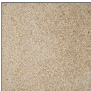
PR-4 6/9 40x40 fons MARFIL