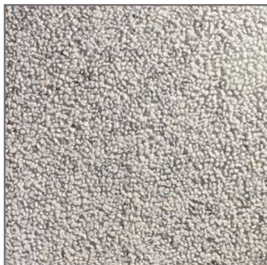
PR-17 6/9 40x40 fons BLANC