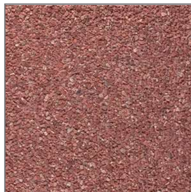
PR-25-E 3/6 fons VERMELL 40x40