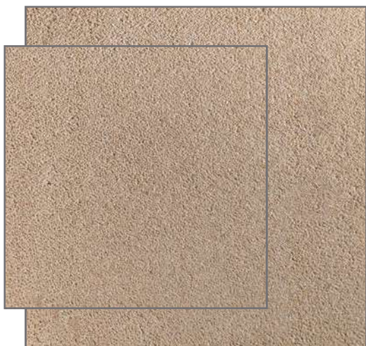
PR-691 1/3 ▲ 40x40 - 50x50 fons BLANC