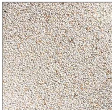
PR-60 3/6 40x40 fons BLANC Macael platja piscines